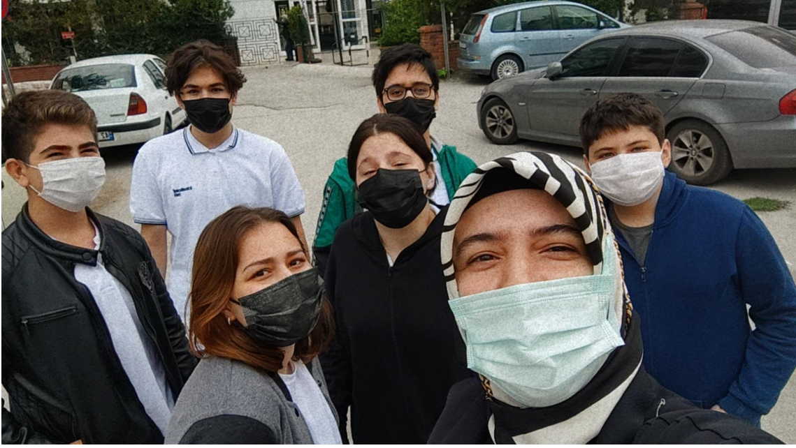
Bilinçli Tüketici Kulübü