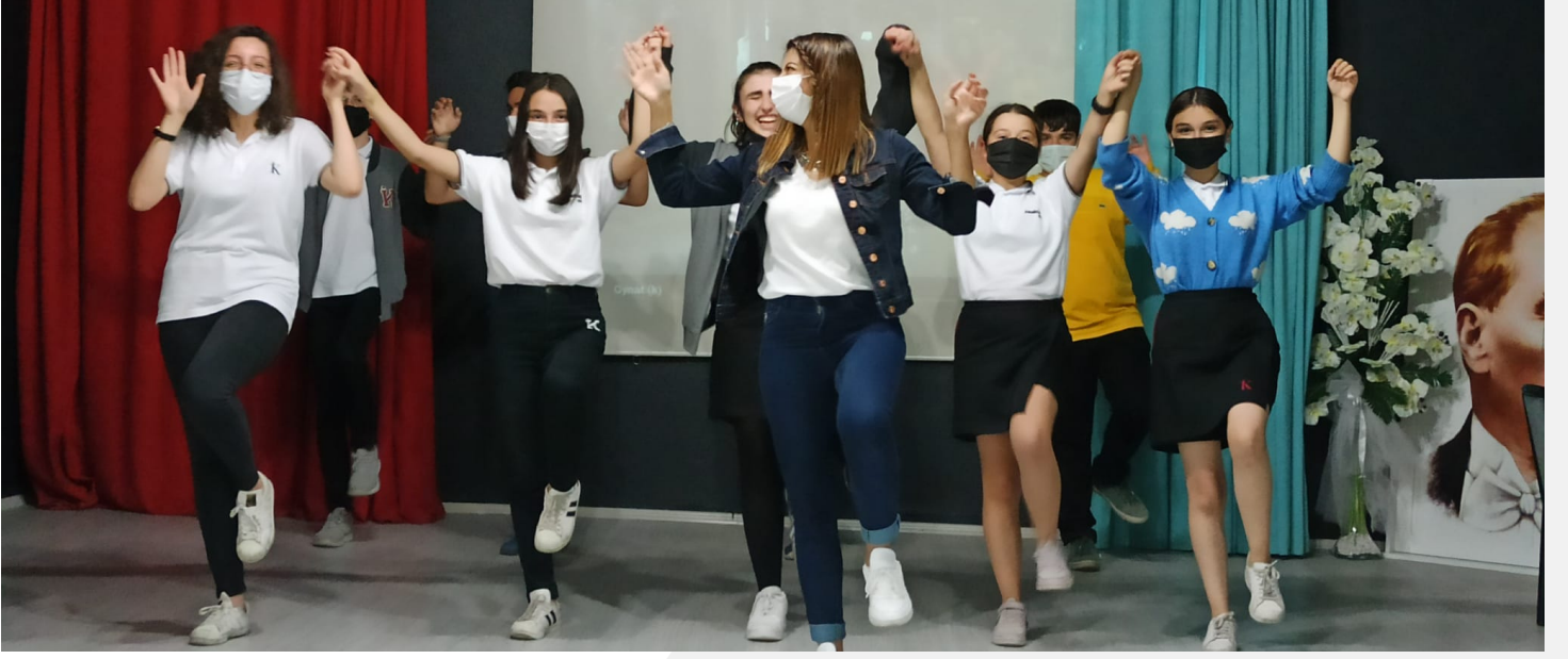
Halk Oyunları Kulübü