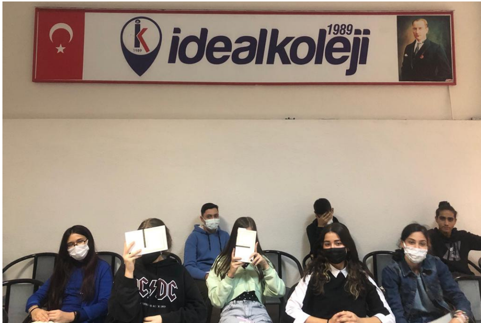
Kültür ve Edebiyat Kulübü